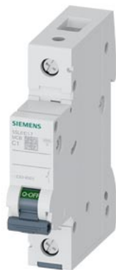
小型断路器 230/400V 6kA, 1极, C, 1A